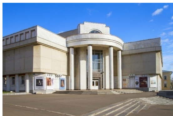
Рисунок 1. Вятский художественный музей имени В.М. и А.М. Васнецовых